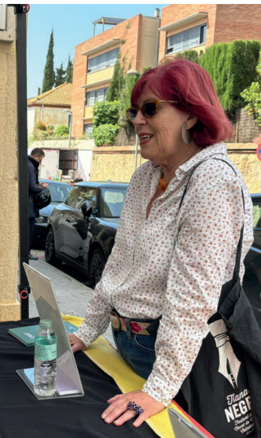
poemari, per Sant Jordi, a Tiana. AJ TIANA