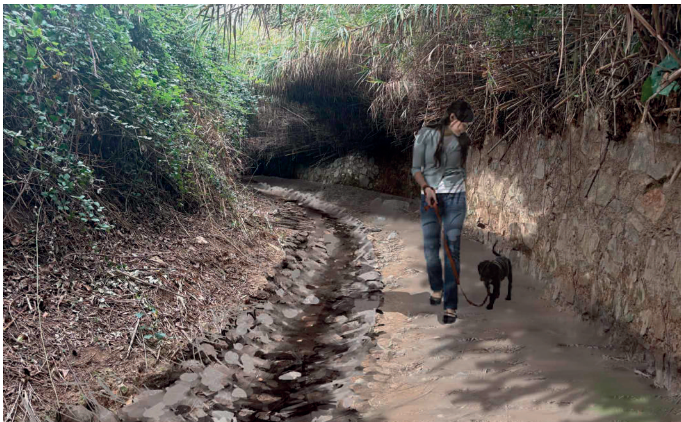
Un dels objectius del nou camí és que sigui accessible i conviski amb el torrent, com es veu en aquesta recreació virtual. AR47