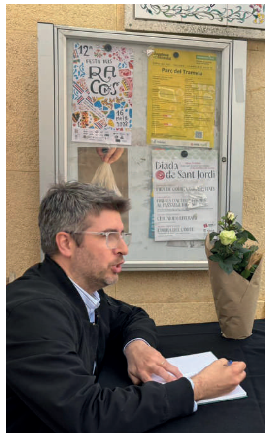
Autors, autoritats, amics i familiars, a la presentació del llibre dels Capgrossos.