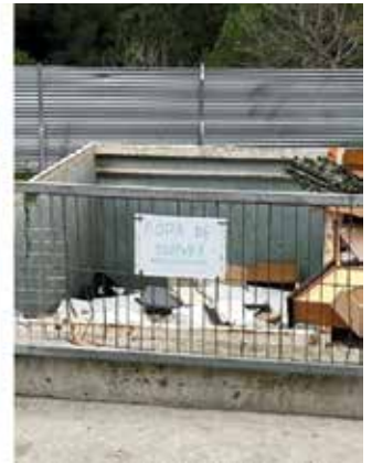
Dipòsits fora de servei a la deixalleria. JUNTS PER CATALUNYA

Continuarem treballant perquè es garanteixi una gestió eficient dels recursos públics