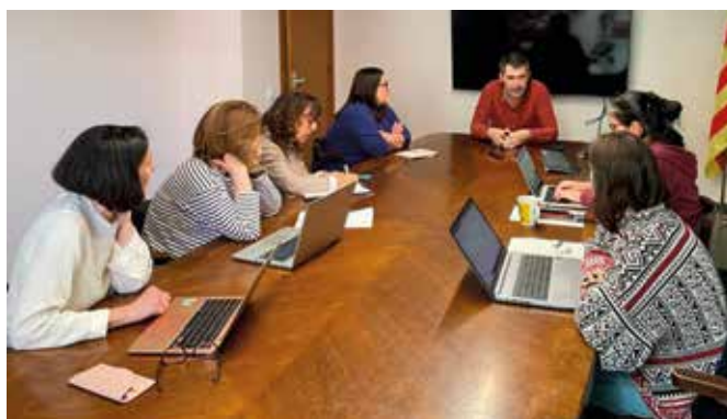
El pla es desplega amb la implicació de molts agents. AJ TIANA