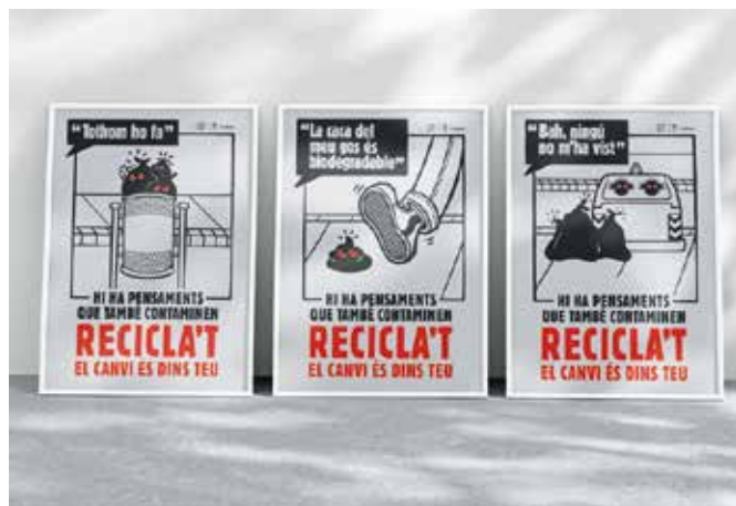
Cartells de la campanya de foment del civisme. AJ TIANA

Als domicilis, es repartirà un díptic que recorda tots els serveis relacionats amb