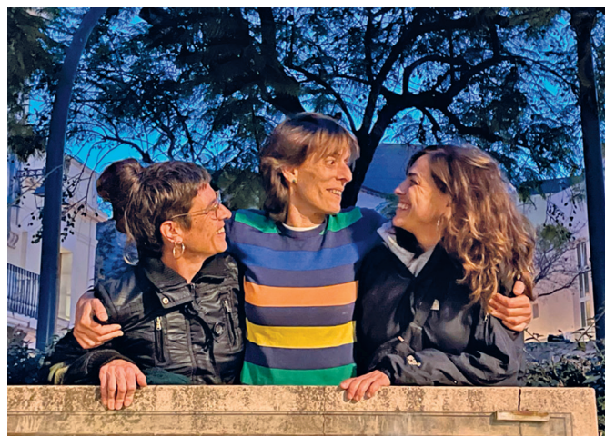
Les organitzadores de les últimes Festes dels Racons. AJ TIANA

Fa deu anys, quatre noies van crear la Festa dels Racons i la van consolidar en el calendari del poble: "Van tirar-la endavant cinc anys, van fer una crida i van poder traspasar el lideratge". Ara les organitzadores de les últimes edicions han iniciat el procés per calcar la jugada. I ja hi ha resultats: una desena de persones es van reunir fa setmanes amb les tres organitzadores per conèixer els detalls del que suposaria assumir el lideratge de la festa. "Els vam explicar com