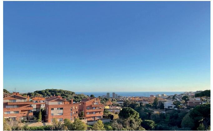
L'acord permetrà millorar el benestar de Tiana. AJ TIANA

L'acord amb Junts per Tiana és un compromís amb la política útil i el progrés del poble