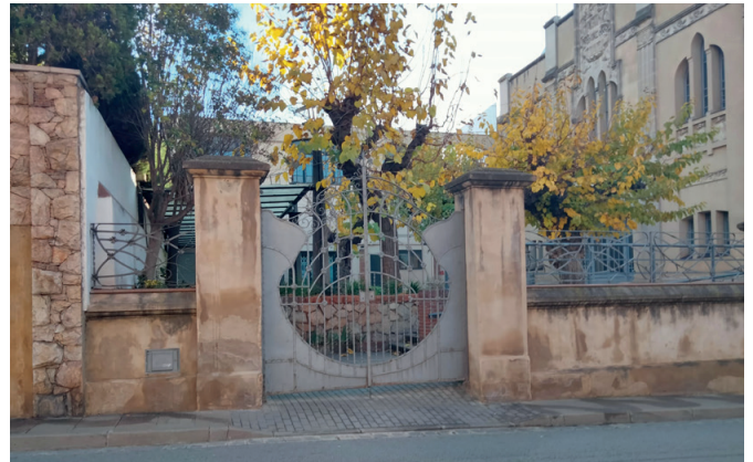
El bar del Casal de Tiana, tancat per Nadal.

nants del plec? Una culpa compartida entre govern i concessionari? El govern encara no ha donat cap mena d'explicació, en la seva línia que ells ho fan tot bé. S'han afanyat a treure un nou concurs, amb manca de reflexió de què ha passat i només amb quinze dies per preparar una proposta. El nou plec té significatives diferències amb l'anterior. per exemple, desapareix l'anomenat comitè d'experts, gran invent del primer concurs i al qual es va donar tota la responsabilitat a l'adjudicació ara fallida. Alguna cosa no deu haver funcionat bé quan ara ha desaparegut. Hi ha altres modificacions en horaris, preus, dinamització cultural, en la mesa de contractació,