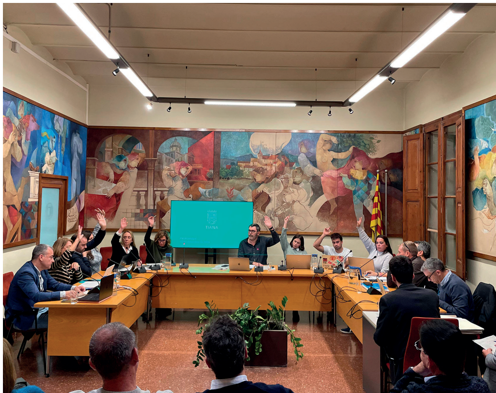
El ple de l'Ajuntament va aprovar els pressupostos municipals el passat 13 de desembre. AJ TIANA