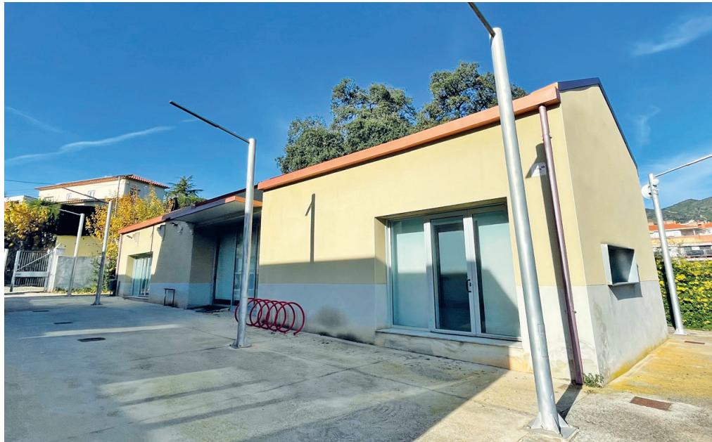
Els Serveis Socials de l'Ajuntament s'instal·laran a l'edifici de l'Escorxador.

Ara, el buc es manté, i la zona que ocupava l'espai