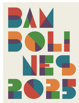
La imatge de Bambolines, en una edició commemorativa dels 25 anys del cicle.

Al llarg de la temporada, també passaran per la Sala Albéniz el grup musical infantil La Tresca i la Verdesca, les companyies El Pot Petit i La Bleda Teatre i el pallaso Marce Gros, entre d'altres.