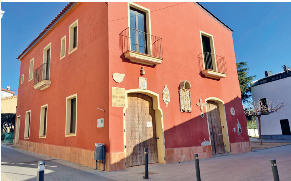
Les obres permetran culminar la reforma de Can Riera com a centre de les arts.

Una de les grans reivindicacions històriques del món de la cultura a Tiana és a punt de fer-se realitat. L'Ajuntament ja ha aprovat les obres perquè Can Riera es converteixi finalment en un espai de les arts al servei del poble.