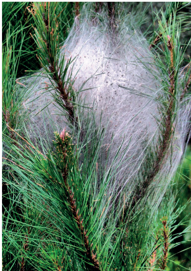
La processionària surt de les bosses a partir del febrer. AJ TIANA

Per a extensions més grans de pins pot arribar a sortir a compte la tècnica de la polvorització. No és tan efectiva com les anteriors, però "en poca estona pots actuar sobre un bon grup d'arbres". En jardins petits on hi ha pocs arbres perd el sentit, però en petits trossos de boscos o zones amb força pins se sol utilitzar.