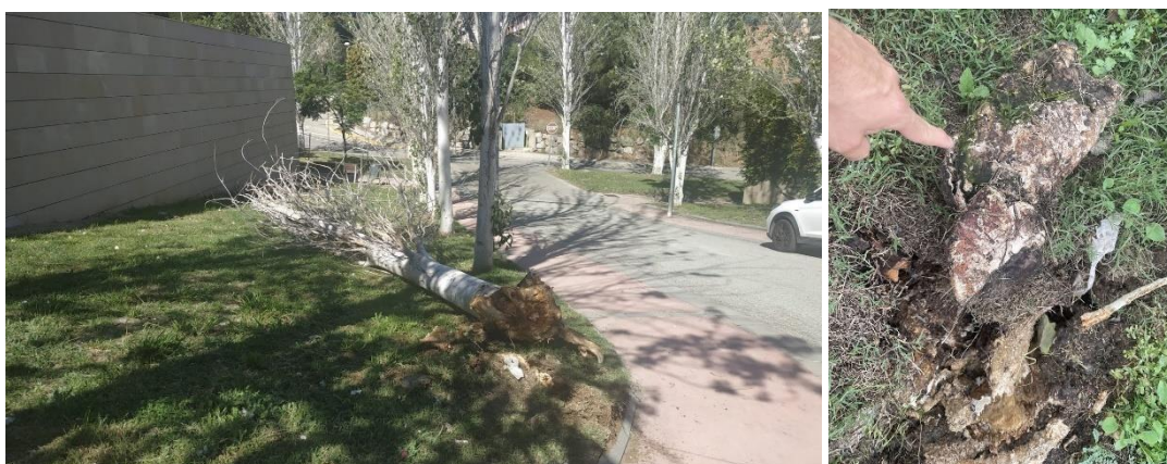
Imatge 1. Exemplar EV023-A123, caigut a data de 30 de setembre de 2024. A la dreta, cos fructífer de Ganoderma sp.