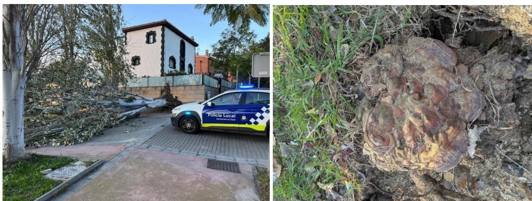
Imatge 3. Exemplar EV023-A007, caigut a data de 22 de novembre de 2024. A la dreta, cos fructífer de Ganoderma sp.