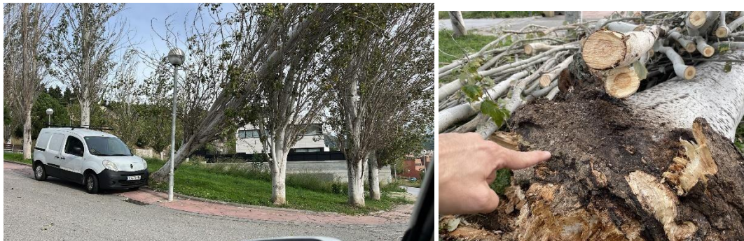
Imatge 2. Exemplar EV023-A018, caigut a data de 20 de novembre de 2024. A la dreta, arrel espiralitzada entorn del coll de l'arbre.