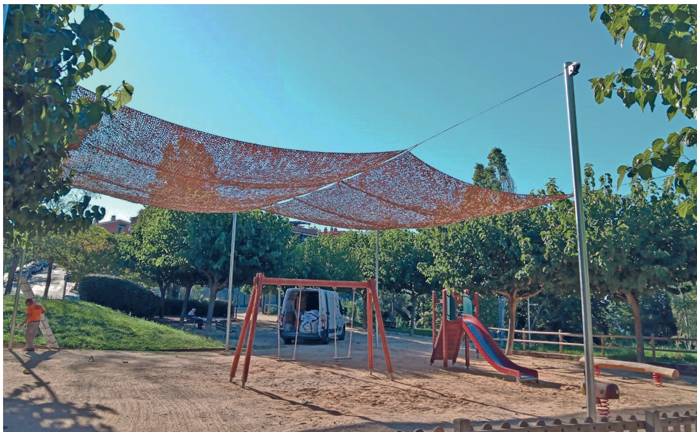
Un dels parcs on s'ha instal·lat una pèrgola per protegir de la calor és al de Joan Armengol i Moliner, a Can Gaietà. AJ TIANA