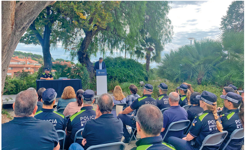
L'alcalde va aprofitar el Dia de la Policia per reclamar més mitjans a la Generalitat.