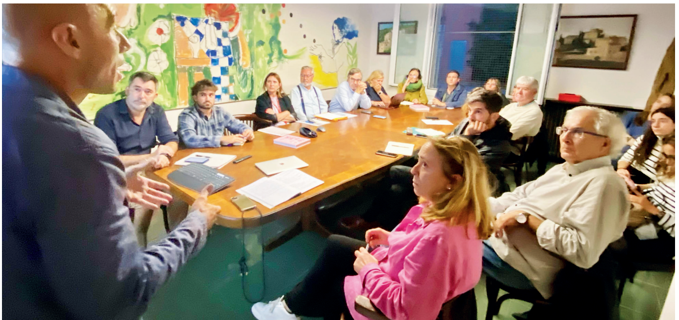
Reunió del Consell Assessor d'Urbanisme de Tiana amb l'Institut Metropolità de Promoció de Sòl (IMPSOL) de l'AMB. AJ TIANA